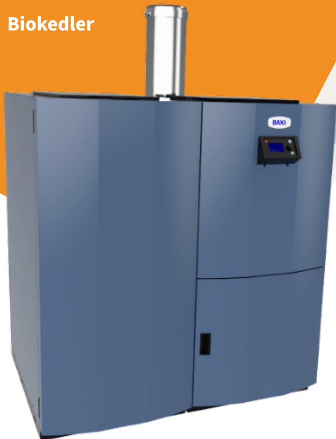
TPK HS20 m/ 200 l kompakt magasin