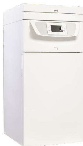
Indedel 6,11 & 16 kW