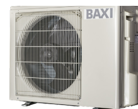
Udedel 6 kW