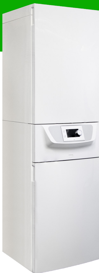
Indedel 6,11 & 16 kW inkl. integreret buffer, 55 liter